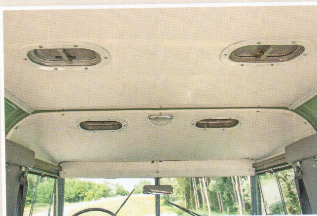
Négy zsalun jöhet a friss levegő a szafaritetőn keresztül. A mennyezeti lámpa Ausztráliából érkezett

biztonságérzetet sugárzó formája. Évekig érlelődött benne a gondolat, aztán eljött a pillanat. Szerencsésen indult a projekt, ami-